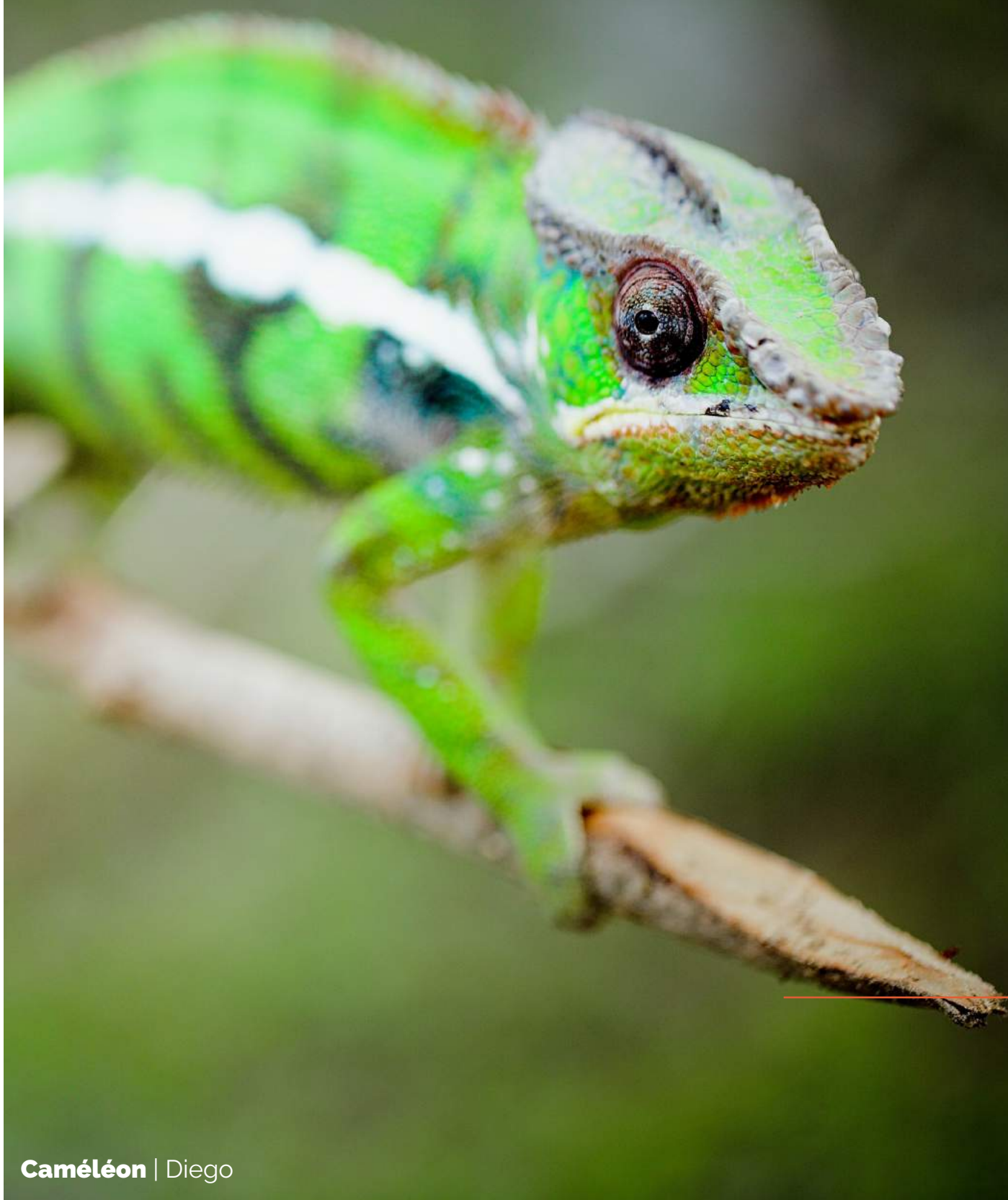
Caméléon | Diego

“ OÙ que vous mène votre voyage, à n’importe quelle période, souvenez-vous de respecter la nature, de respecter la culture, et de respecter votre hôte. ”